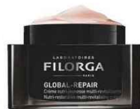
5 Crème. Global Repair Crème Multi-Active, 89,90 €, Filorga .