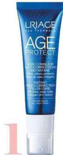
1 Base. Age Protect, soin Combleur Multi-Corrections Instantané, 35 €, Uriage .

Crème la journée, sleeping mask la nuit... Ce soin à la formule concentrée combine nutriments anti-âge et méso-ingrédients inspirés de la médecine esthétique. Il s'utilise à tout moment pour apporter élasticité et rebond aux peaux dévitalisées.