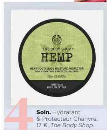
4 Soin. Hydratant & Protecteur Chanvre, 17 €, The Body Shop .