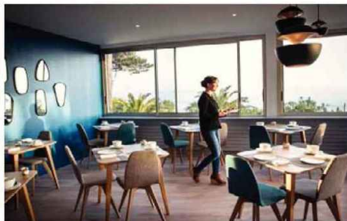
Dans la Villa Les Hydrangéas, jolie maison années 1930 aménagée en hôtel, le petit déjeuner (délicieux) se prend face à la mer.

JEAN-CLAUDE MOSCHETTI/REA POUR LE POINT n° 033