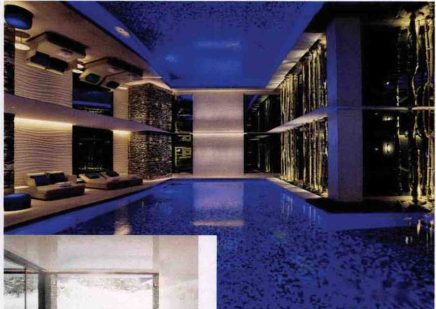
Plonger dans une eau très chaude quand la température extérieure est en dessous de zéro, le rêve absolu.

A noter Le 14 février, les clientes de l'hôtel seront invitées au spa pour choisir leur couleur de rouge à lèvres favorite. Rdv sur chevalblanc.com.