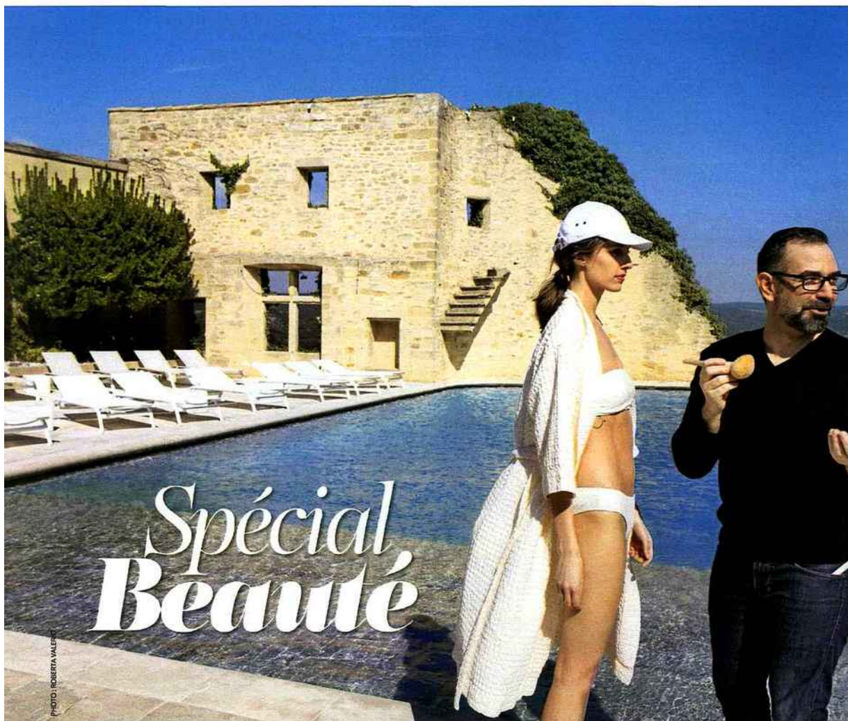
Mise en beauté réalisée par Olivier Tissot avec : Poudre Compacte Bonne Mine, Lait-Crème Riche Corps peaux sèches et très sèches, Embryolisse. Maillot de bain Billabong. Casquette Lacoste.

U n regard plutôt qu'un make-up, une personnalité plutôt qu'une femme accessoire: Olivier Tissot, Maquilleur et Skin Care Expert Embryolisse , est un créateur inspiré par la force des femmes. « Le maquillage est un prétexte à la beauté, il doit mettre en avant la personnalité par le biais d'une émotion », témoigne l'expert des catwalks, amoureux de la nature, qui signe de son coup de pinceau des teints frais