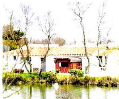
>> Le Mas de la Fouque, en Camargue, premier «joyau» de H8 Collection.

d'un 5 étoiles a déjà investi dans une dizaine d'entreprises et presque autant de secteurs : le Web (Etoilecasting.com, Startinig Dot...), l'automobile d'occasion (Autoreflex), la restauration (L'Arc), la ganterie, la maroquinerie et l'horlogerie de luxe (Lavabre Cadet), les médias (MFM), les VTC (Drive),